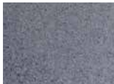
granite foncé graniet donker