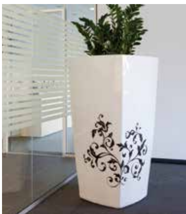
Couleurs personnalisées selon RAL ou même motifs et logos possibles sur demande.