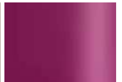
baie (similaire à RAL 4006) berry (zoals RAL 4006)