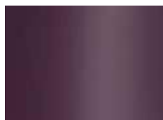
aubergine (simi. à RAL 4007) aubergine (zoals RAL 4007)