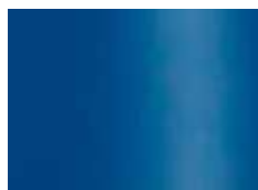
bleu signalisation (simi. à RAL 5017) verkeersblauw (zoals RAL 5017)