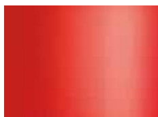
rouge signalisation (sim. à RAL 3020) verkeersrood (zoals RAL 3020)