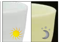
blanc fluo wit fluo