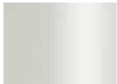
blanc (similaire à RAL 9003) wit (zoals RAL 9003)