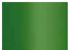
apple (similaire à RAL 6018) apple (zoals RAL 6018)