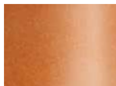
terre cuite terracotta