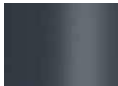
anthracite (sim. à RAL 7016) antraciet (zoals RAL 7016)