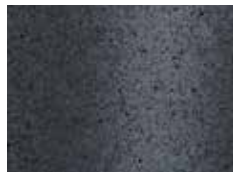
granite anthracite graniet antraciet