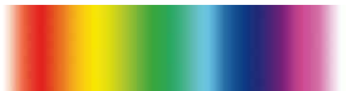
LED-RGB, 8 couleurs LED-RGB 8 kleuren