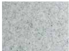
granite clair graniet licht