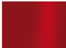
rouge rubis (sim. à RAL 3003) robinrood (zoals RAL 3003)