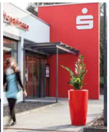
Individuele kleuren volgens RAL of motieven en logo's zijn volgens wens mogelijk.